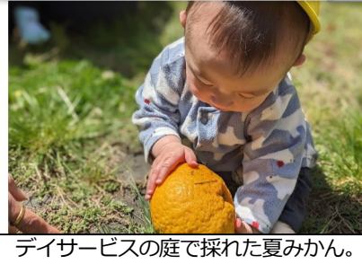
デイサービスの庭で採れた夏みかん。