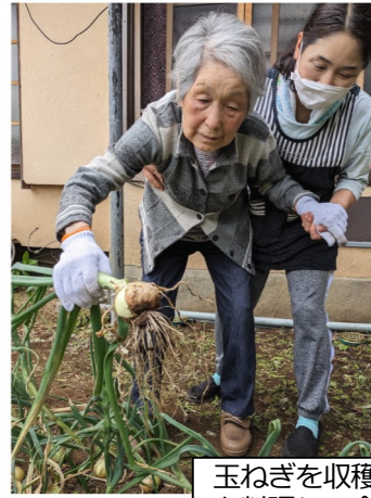
玉ねぎを収穫！採れたて を料理して食べました。