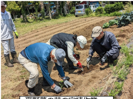
夏野菜の苗の定植作業。