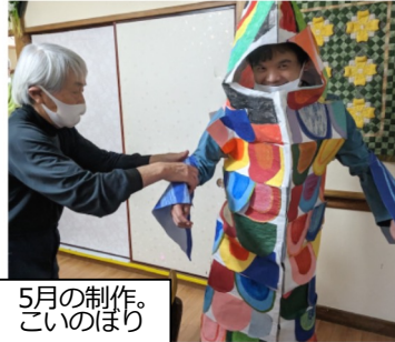
5月の制作。 こいのぼり