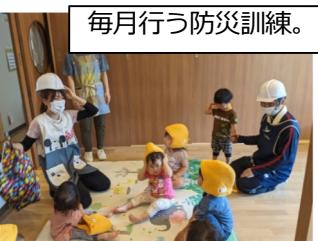
毎月行う防災訓練。