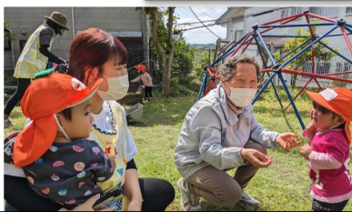
4月入園の子は、まだまだ人見知り。 おばあちゃんが優しく声をかけます。