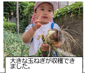
大きな玉ねぎが収穫でき ました。