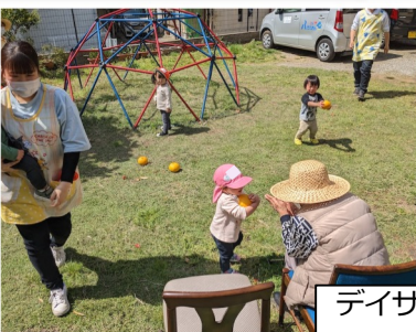
デイサービスでの交流。