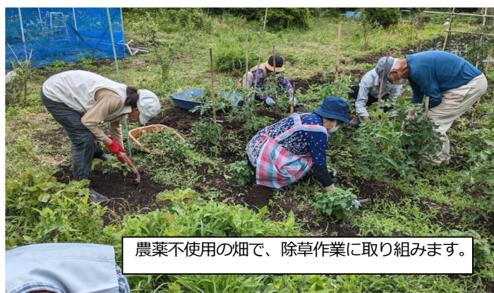
農薬不使用の畑で、除草作業に取り組みます。