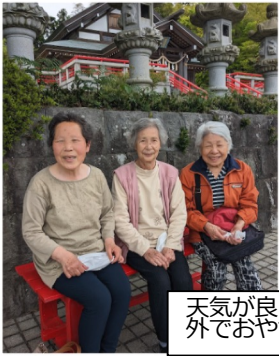
天気が良ければ外におでかけ。 外でおやつも楽しみの一つ。