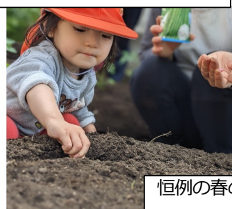
恒例の春の種まき。