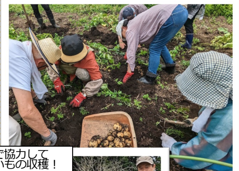
みんなで協力してじゃがいもの収穫！