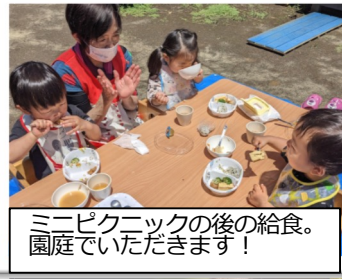
ミニピクニックの後の給食。 園庭でいただきます！