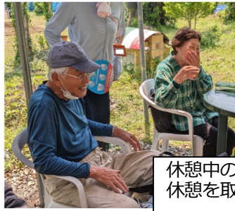
休憩中の水分補給。2時間の活動の中で2~3回休憩を取ります。休憩中の会話の魅力の一つ。