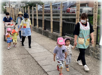
保育所から幼稚園まで片道1kmの道のりを歩いて向かいます。