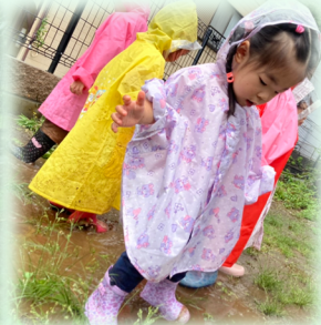
梅雨ということで、デイサービスの庭を使って「雨の日散歩」。あいにく雨は小降りでしたが、水溜りをつくって、たくさん遊んで、泥んこに。