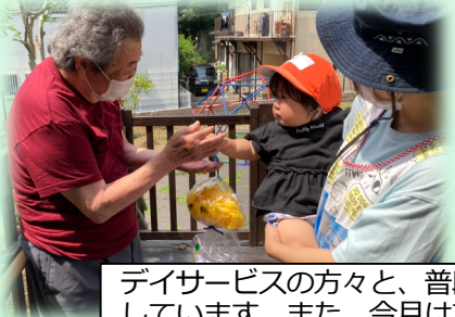
デイサービスの方々と、普段から庭を行き来して交流しています。また、今月はてるてる坊主をつくって、みなさんにプレゼントしました。