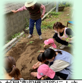
先月植えたトマトやピーマンが早速収穫可能に! さつまいもも、デイの「監督」指導のもと、植え付けを行いました。