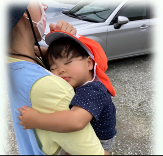
帰りは疲れて寝てしまう子ども。少しずつ体力を付けていきます。