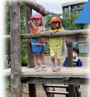
幼稚園の遊具でいっぱい遊びました。園庭も砂場も大きい!