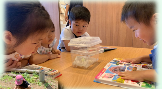
自然への興味が高まっています。うさぎ組でブームのお外でダンゴムシ探しその他、モンシロチョウの羽化を見守りました。